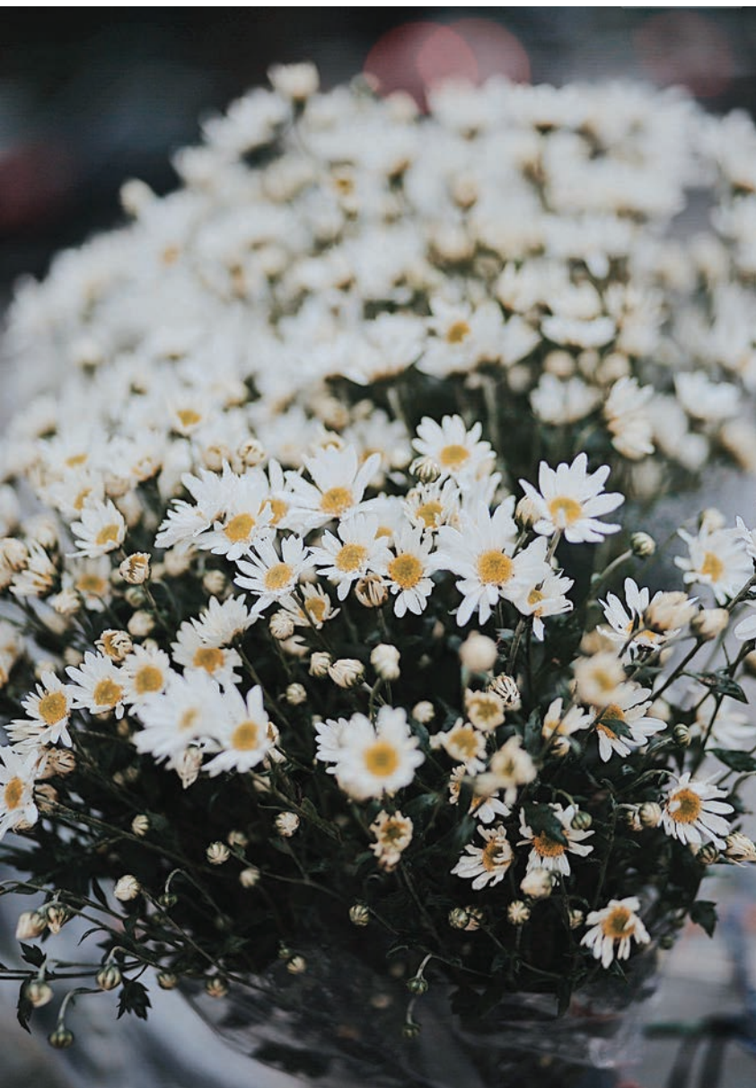
Cúc họa mi chờ mùa đông về cho Hà Nội